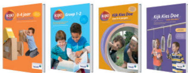
Uitgaven KIJK!: handleidingen voor 0-4-jarigen en groep 1-2.

K inderen ontwikkelen zich grillig. Soms lijken ze even stil te staan, vervolgens maken ze een ontwikkelingsprong. Maar ook al volgt hun ontwikkeling geen rechte lijn, toch willen we graag weten of ze zich voorspoedig ontwikkelen. Het ontwikkeling-volgsysteem KIJK! is daarvoor een heel bruikbaar instrument en wordt op veel scholen en kinderdagverblijven ingezet. Het is ontwikkeld om jonge kinderen te volgen en op basis daarvan een vervolgaanbod te kunnen bieden. KIJK! volgt de totale ontwikkeling van het jonge kind. Denk aan geletterdheid, gecijferdheid, sociaal-emotionele ontwikkeling, motoriek, logisch denken en tekenen. Het geeft een compleet beeld waar een kind staat in zijn ontwikkeling. KIJK! laat zien hoe de ontwikkeling van het kind zich verhoudt tot de leerlijn. Liesbeth van Waas, Adviseur KIJK! bij Bazalt Groep: “Daardoor zie je als leerkracht meteen wat je doelen zijn. Vervolgens kun je je aanbod daar beredeneerd op aanpassen.”