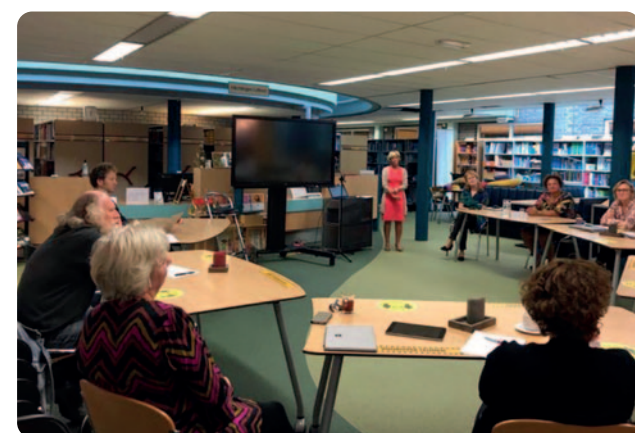
In debat over inclusief onderwijs.

Inclusief onderwijs is echt iets anders dan passend onderwijs. In het rapport Steeds inclusiever focust de Onderwijsraad op leerlingen met een beperking. Met een beperking bedoelt de raad een kenmerk of een aandoening die iemand kan belemmeren om deel te nemen aan bijvoorbeeld onderwijs. De beperking kan lichamelijk en/of mentaal zijn, en structureel of tijdelijk van aard.