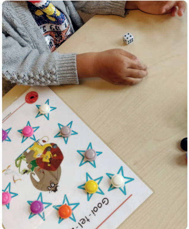
Dit spel komt uit het project Mag ik meedoen?, verkrijgbaar bij Kleuteruniversiteit.