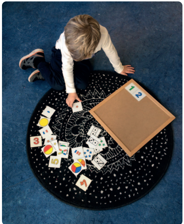
Waar zou jij meer tijd voor willen hebben op school? Hoe kun je daar tijd voor maken?