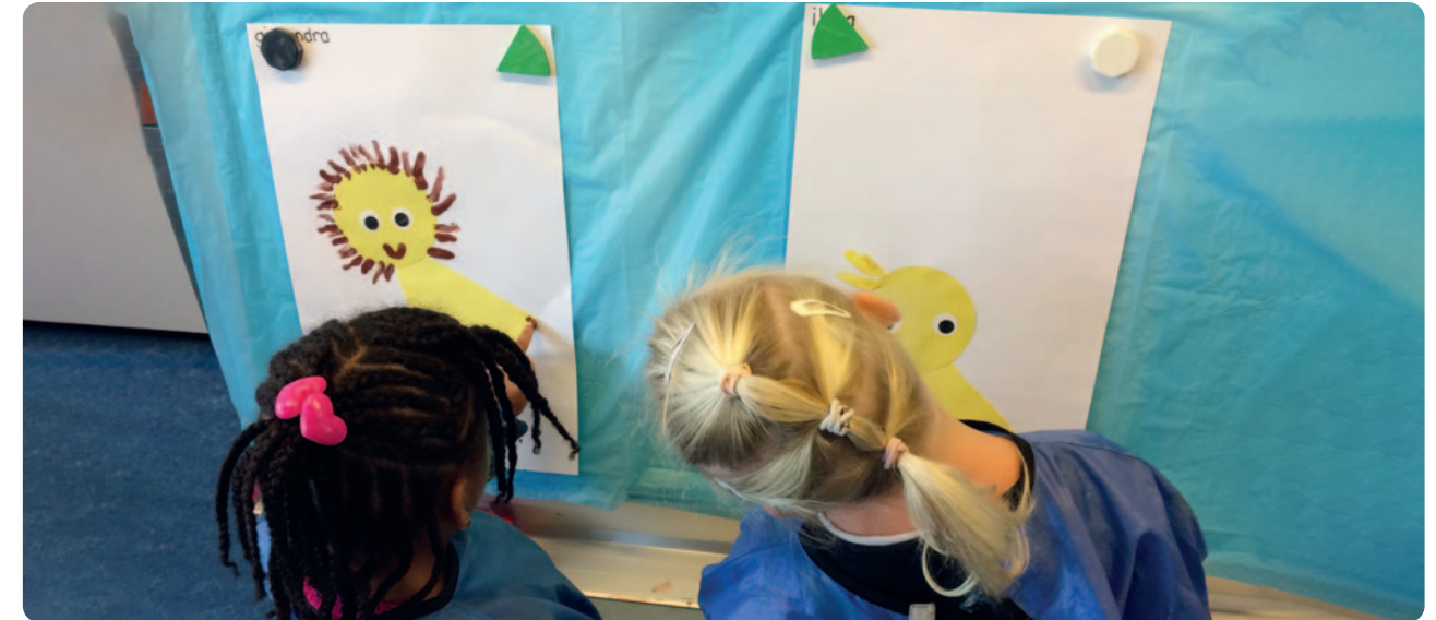
Kijk regelmatig of je nog op het juiste pad wandelt.

Haar advies aan schoolleiders is daarom: kijk samen met je onderbouwteam hoe de schoolbrede visie op onderwijs ook toe