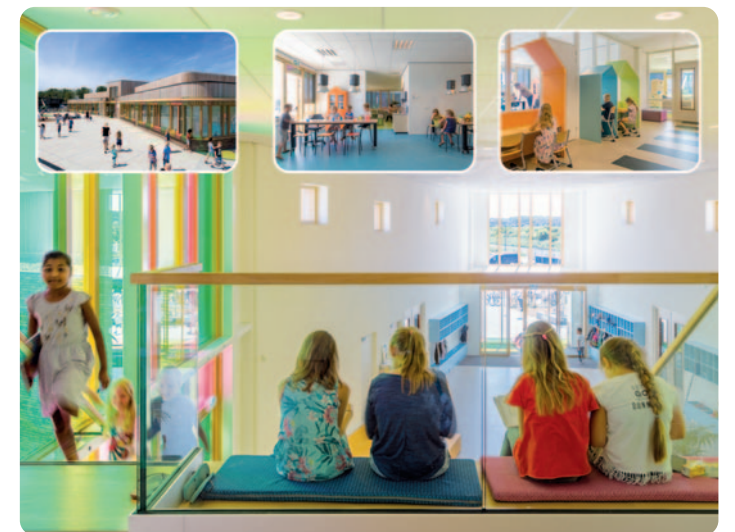
IKC Warande: opgroeien in verbondenheid.

Hoe vertaal je de visie naar de praktijk? Op IKC Warande werden er vier werkgroepen gevormd die heel concreet zijn gaan ontwerpen: als dit onze visie is, wat zien we dan in de praktijk? Leerkrachten en pedagogisch medewerkers mochten het zelf bedenken, ze mochten er wat van vinden en ze mochten er aan werken. Voor de eenheid en de sturing is het TASC-model gebruikt. Dit model hangt nog steeds in de koffiekamer. Aan de hand daarvan leggen unitcoördinatoren bezoeken af en wordt een interne teamcoach ingezet die zich richt op de vraag of de medewerkers doen wat ze zeggen. Op IKC Warande heeft het team van leerkrachten en pedagogisch medewerkers de volgende missie ontwikkeld: opgroeien in verbondenheid.