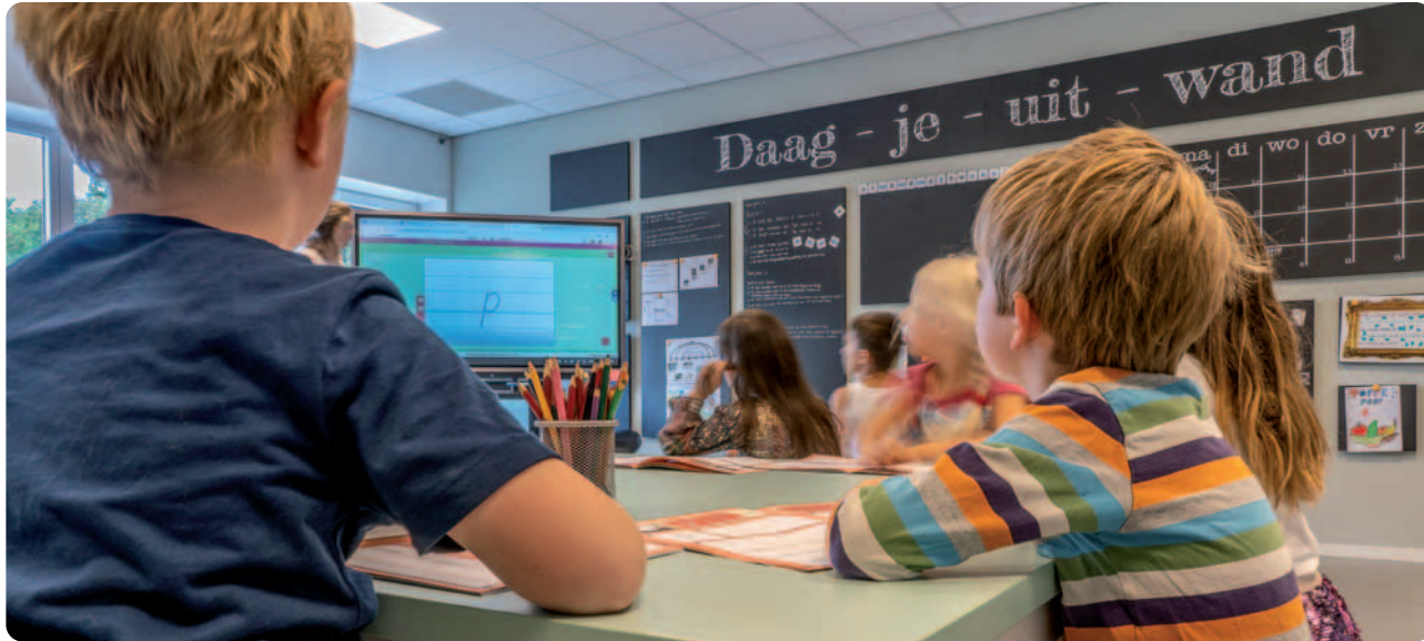
Uitdagend onderwijs op een school in Nijmegen.

structie geven we per groep? Gaan we leraren verschillende taken geven? Hoe gebruiken we de ruimten? Hoe ondersteunt adaptieve digitale software hierbij? Gaan we het wellicht per bouw organiseren? Eerst alleen op bepaalde dagen voor bijvoorbeeld handelend rekenen? Welke criteria gebruiken we om instructiegroepen te maken?