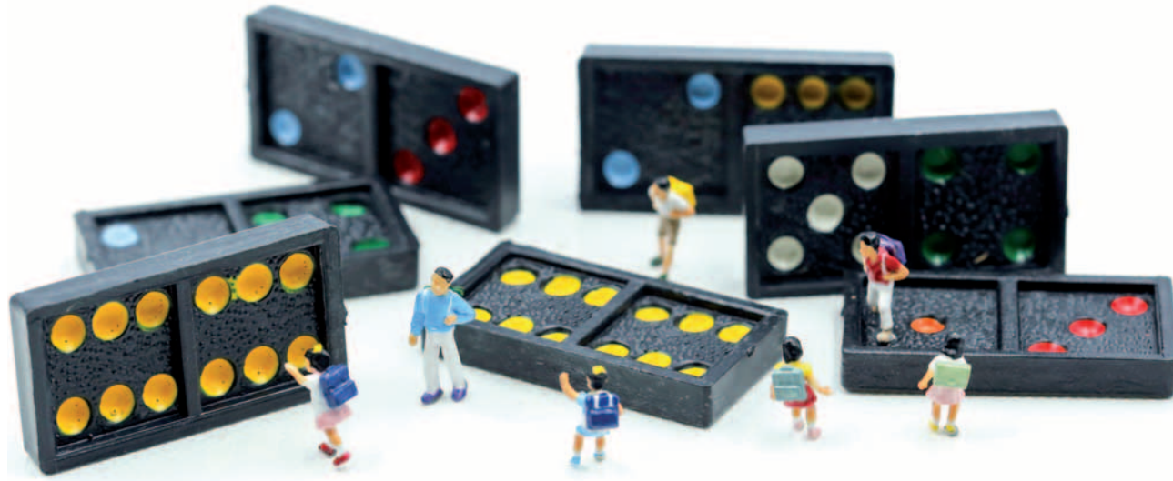
Spelend met bouwmaterialen en met bordspelletjes ontdekken leerlingen manieren om hoeveelheden te splitsen en minder te hoeven tellen. Het gebruik van het 'grote' dominospel (55 stenen met dubbel negen als hoogste) is daarbij heel helpend.

perspectief minder belangrijk dan vroeger. In de echte wereld zijn daarvoor rekenapps en programma's voor dataverzameling en -analyse die dat veel effectiever doen. Alleen moeten de gebruikers daarvan wel snappen welke bewerkingen nodig zijn, en onderscheid kunnen maken tussen de noodzaak tot precies uitrekenen en kunnen volstaan met een schatting met ronde getallen. Bovendien moeten die gebruikers ook conclusies kunnen trekken uit de gevonden uitkomst, want dat was tenslotte de reden om met die getallen aan de slag te gaan. Dit vraagt andere accenten en een heel actieve rol van de leerlingen.