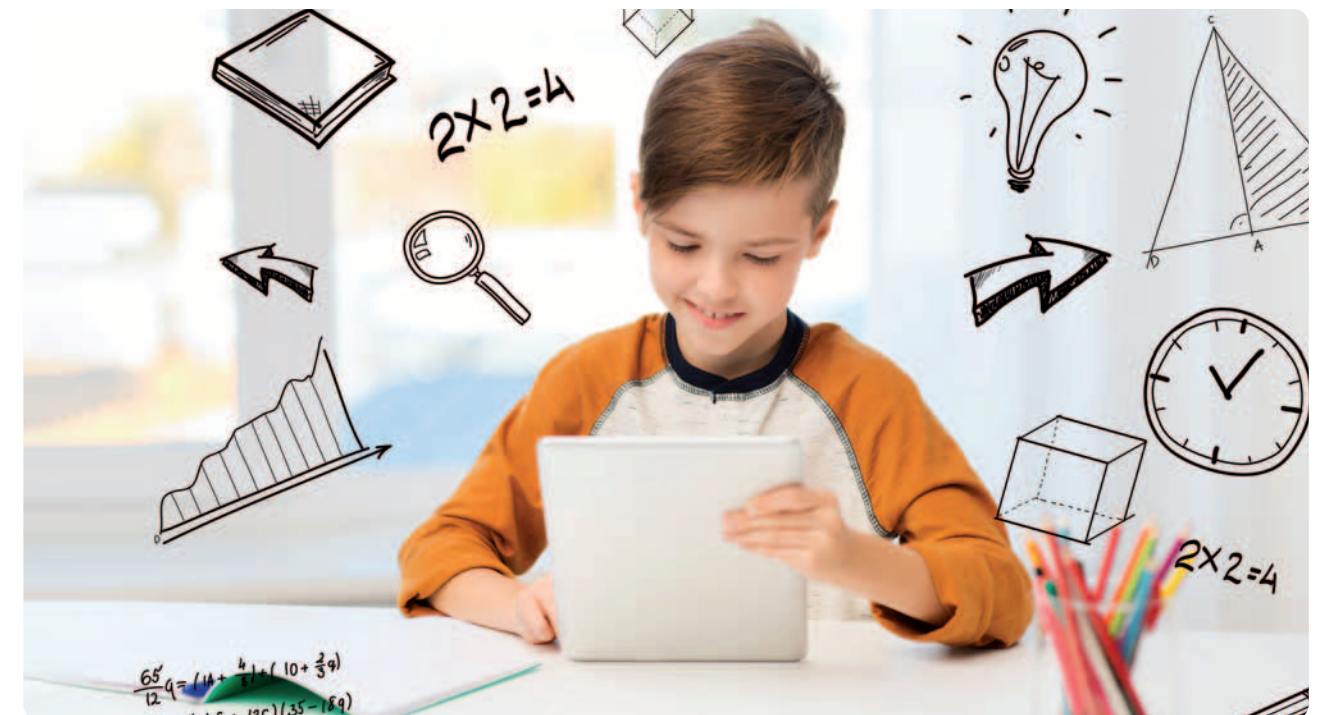
Oefenen is per definitie maatwerk. Kinderen moeten dus kritisch nagaan wat ze al wel kunnen of weten en wat niet.

De kinderen moeten daarbij in de gaten houden dat ze alleen oefenen wat ze nog niet weten, want anders is het geen oefenen. Dit betekent dat dit oefenen per definitie maatwerk is en dat de kinderen dus kritisch moeten nagaan wat ze al wel kunnen of weten en wat niet. Het gaat er dus niet om dat ze oefentijd vullen. Dit is ook niet iets dat klassikaal kan, omdat de leerling dan niet verantwoordelijk is voor wat zij/hij oefent. Juist die reflectie en het zelf ervaren van de eigen invloed leidt tot een houding waarvan ze ook in volgende jaren zullen profiteren. Daar hoort wel bij dat ze, zodra ze hun doel als 'behaald' hebben afgetekend, ook het bewijs van dat succes moeten kunnen leveren. Dit voorkomt dat ze zichzelf wat voor de gek houden en te snel tevreden zijn met een beetje kennis of vaardigheid. Dit zorgt er ook voor dat ze leren dat ze dit oefenen voor zichzelf doen en niet