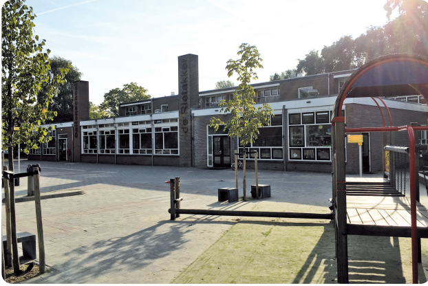
Basisschool De Rietakker in De Bilt

je lef en moed nodig om te zeggen en te doen wat belangrijk is. Dat leren we onze kinderen, maar ook voor onszelf en voor onze ouders is dat een dingetje. Tot slot de staart van Rico, dat is de staart van een vos. Deze staat niet voor sluw, maar voor slim. Het staat voor handige manieren bedenken om dingen op te lossen. Op basis van deze mascotte hebben we het in de klas over verschillende waarden: over veiligheid, communicatie, ontwikkeling, zelfstandigheid, identiteit.'