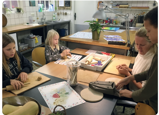
Op de sociocratische school zijn geen vaste lokalen, wel functionele ruimtes.

naar hoe een kind leert lopen en praten. Dat doet het in z'n eigen tempo en op z'n eigen manier. Die innerlijke motivatie en aangeboren nieuwsgierigheid zijn bij ons het uitgangspunt voor het leerproces van een kind. De eigen interesses, talenten en mogelijkheden staan daarbij centraal.'