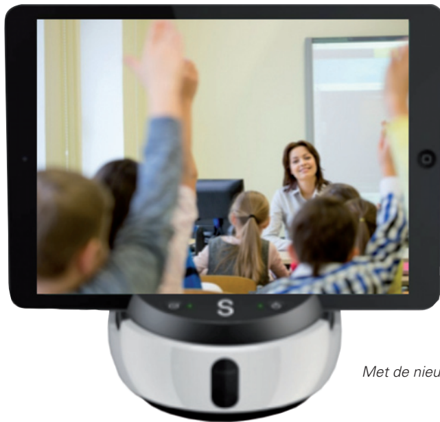
Met de nieuwste technieken kunt u eenvoudig zelf uw lessen filmen.