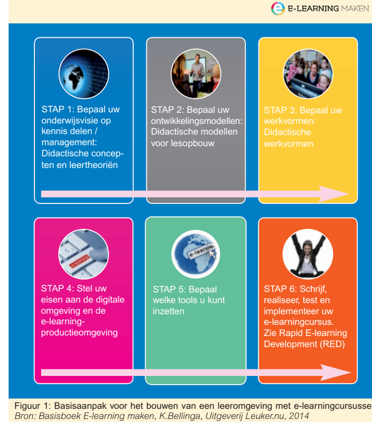
Figuur 1: Basisaanpak voor het bouwen van een leeromgeving met e-learningcursussen.

naar de welbekende didactische uitgangspunten. Dat bepaalt de kwaliteit, de effectiviteit en het resultaat van de te volgen e-learningcursus.