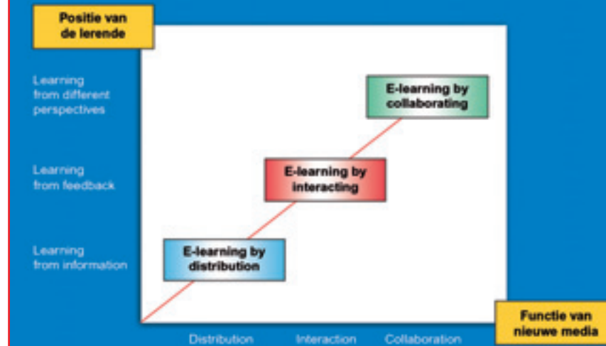
Figuur 1: Drie soorten e-learning (Reinmann-Rothmeier, 2003).

Indien het doel van de cursus dus in te vullen is met een e-learningcursus, dan is dit tot een factor 3,5 goedkoper.