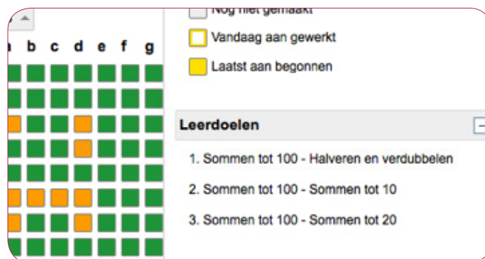
afbeelding 2: doelen in het dashboard

instructiefilmpje om de les in te leiden. In het dashboard ziet de leerkracht alle opgaven van de les. Het dashboard stelt de leerkracht in staat om enkele opgaven op het digibord te tonen. Zo bereidt de leerkracht de leerlingen voor op de opgaven die straks gemaakt gaan worden. De leerkracht kan ervoor kiezen om de les voor de leerlingen op 'onzichtbaar' te zetten. Leerlingen worden dan niet afgeleid door informatie op hun tablet.