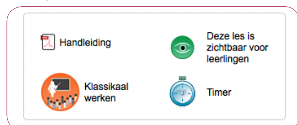
afbeelding 1: klassikaal werken in het dashboard

Bij de fase van het activeren van voorkennis kan de tool "Klassikaal werken" een rol spelen. Snappet biedt hiermee een functie die de leerkracht helpt voorkennis op interactieve wijze op te halen. Deze functie 'klassikaal werken' werkt als een soort 'opwarmer'. Het stelt de leerkracht in staat om alle leerlingen op hetzelfde moment bij de les te betrekken. De leerkracht stelt de leerlingen een open of gesloten vraag en de leerlingen antwoorden via hun tablet. De antwoorden verschijnen direct op het digibord. De leerkracht ziet in één opslag of de leerlingen al dan niet over voldoende voorkennis beschikken.