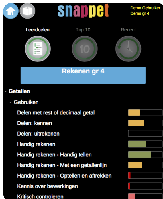
afbeelding 5: top 10 leerdoelen voor de leerling